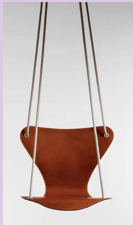
Her 'dekoreret' af Louis Vuitton.

Stolene sendes på verdenssturné, hvor de udstilles i København, London, Milano og New York og bliver i foråret 2006 sat til salg på en international auktion fordel for AIDS-Fondet. Udstillingen af stolene