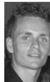
Af Morten Eiersted, informationsmedarbejder

Med den nuværende viden er det derfor meget vigtigt at arbejde imod social stigma og på den måde skabe det fornødne respekt om hiv-smittede.